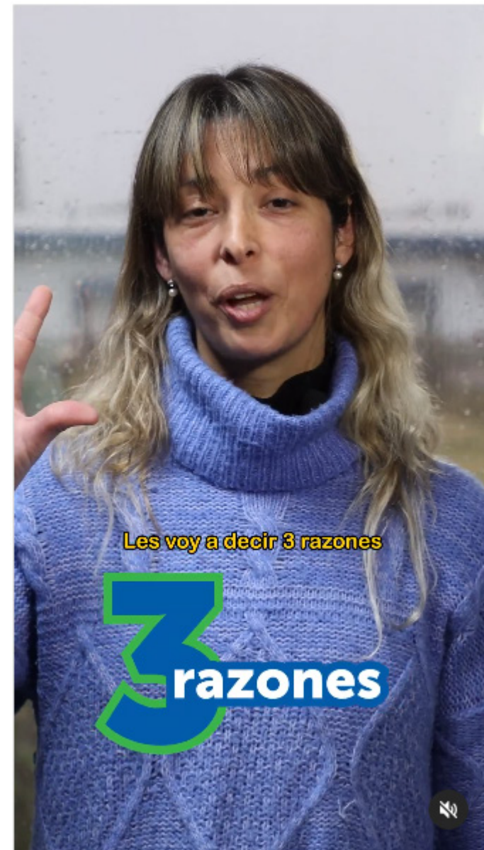
Videos de la iniciativa