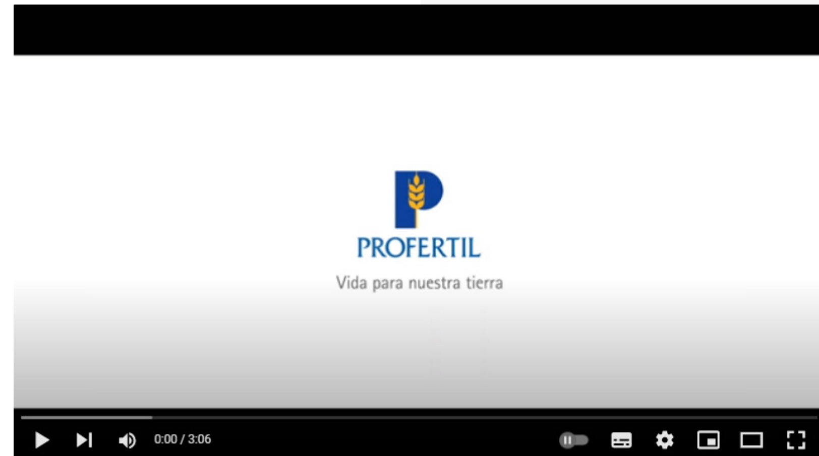
Video institucional de Profertil (Video)